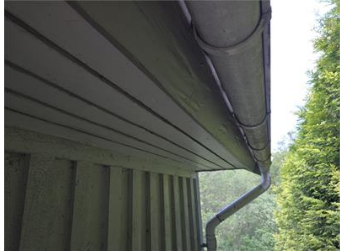
Exempel på färgblåsor i fotbräda.