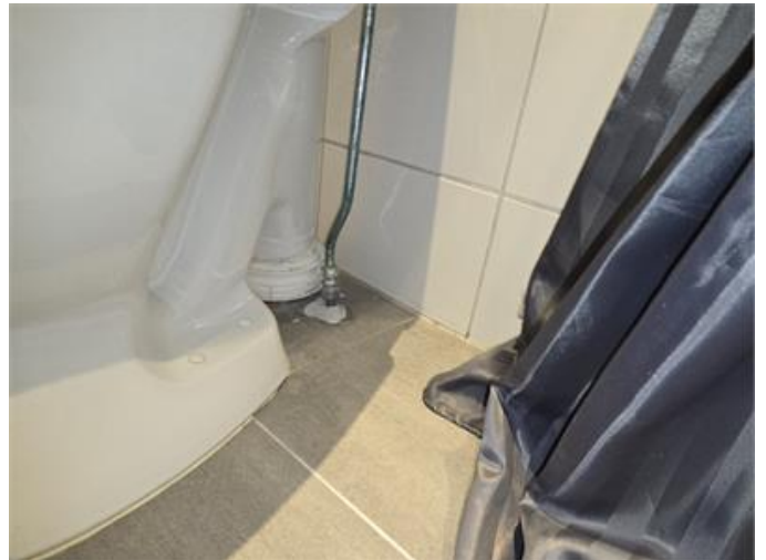
Exempel på rörgenomföring i golv.