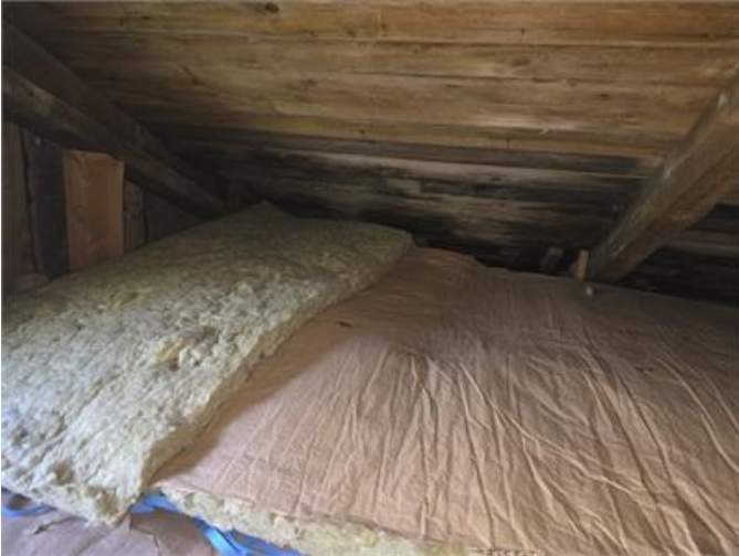
Bilden visar mikrobiell påväxt/missfärgningar på vinden.