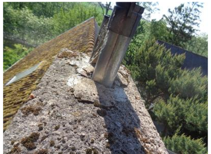
Skorsten vittard i krön.