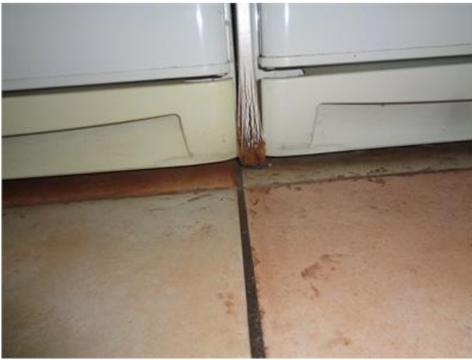
Fuktskador i stödskena mellan kyl och frys.