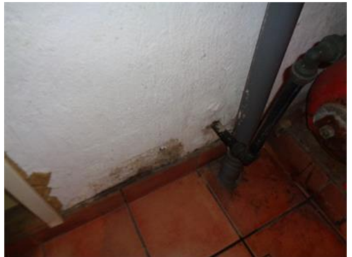
Fuktgenomslag på källarmur.