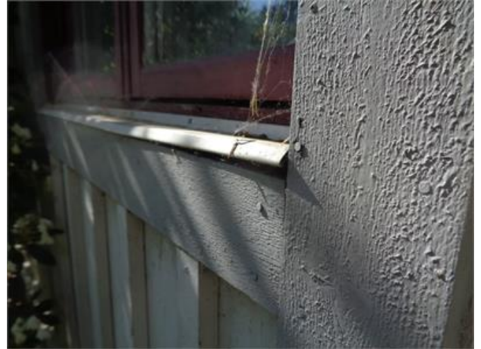
Droplåt med kort överhäng och lyfts lokalt i kant.