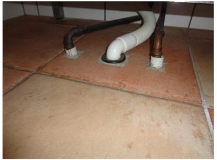
Rör genomföringar i golv i våtrum.