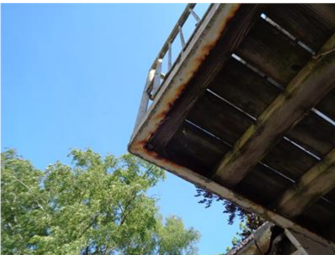
Rostskador i balkongens ram.