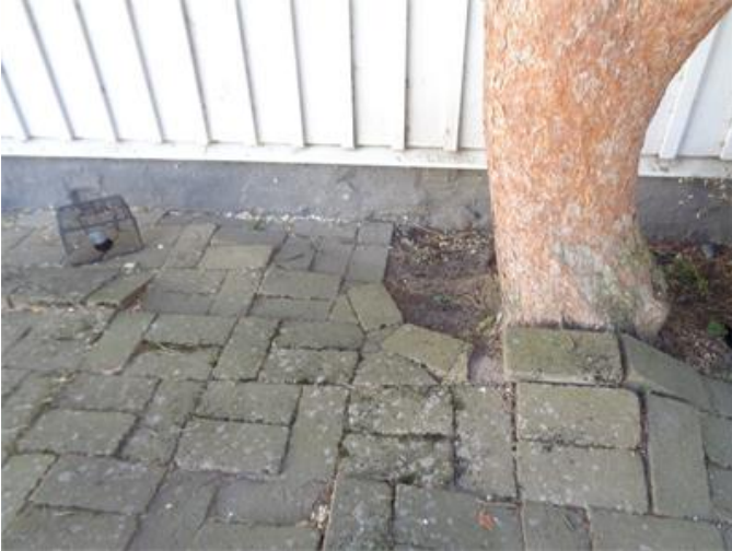
Träd intill grundläggning.