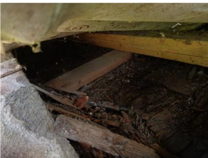
Underlagstak av spån är vittrad