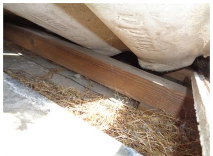
Underlagstal av papp på kupan.