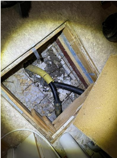
Installationsutrymme i golv.