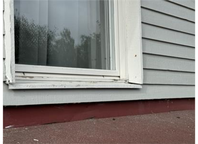
Lokala underhållsbehov på fönster.