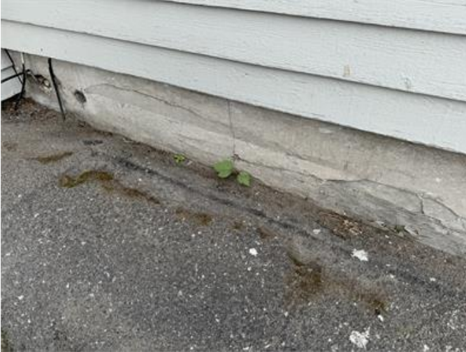
Sockelskiva har vittrat sönder och större hål finns i skivan.