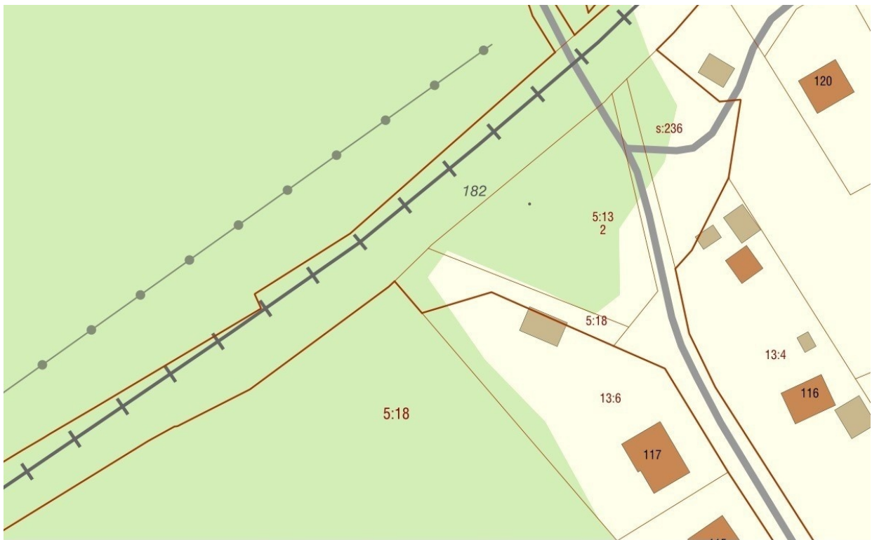
0 m 25 m 50 m 75 m