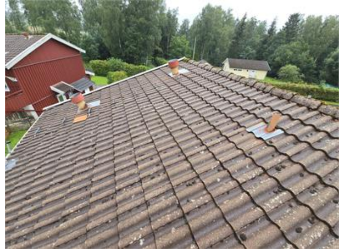
Överblick del av yttertak.