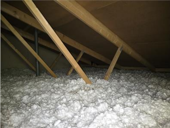
Överblick del av vind.