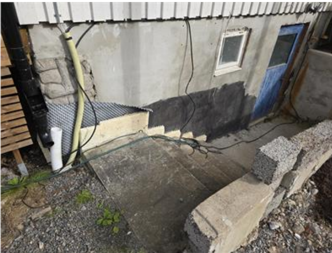
Exempel på bla. Stuprör släpper ut vatten invid huset, brister i dränering och oklamrade kablar.