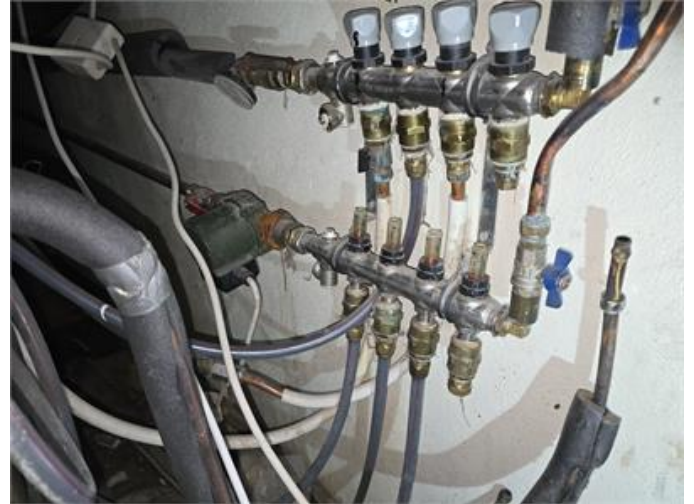
Exempel ärgade kopplingar.