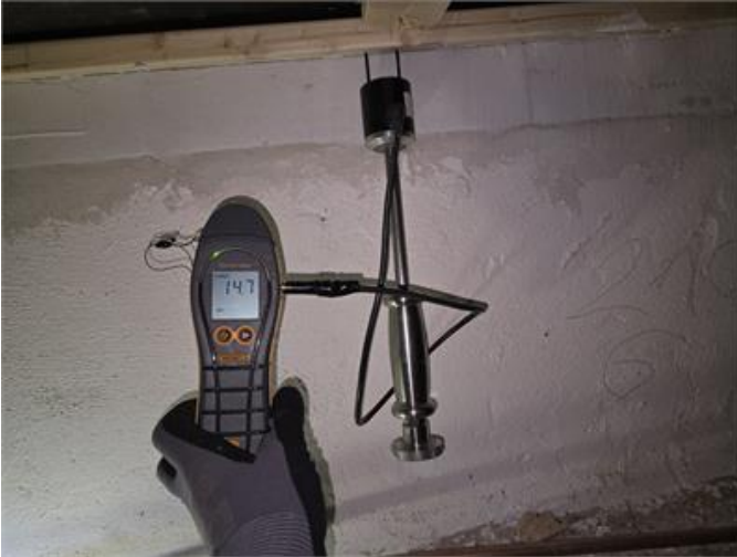
Exempel på mätning i undersidan av bjälklaget i den outgrävda källaren.