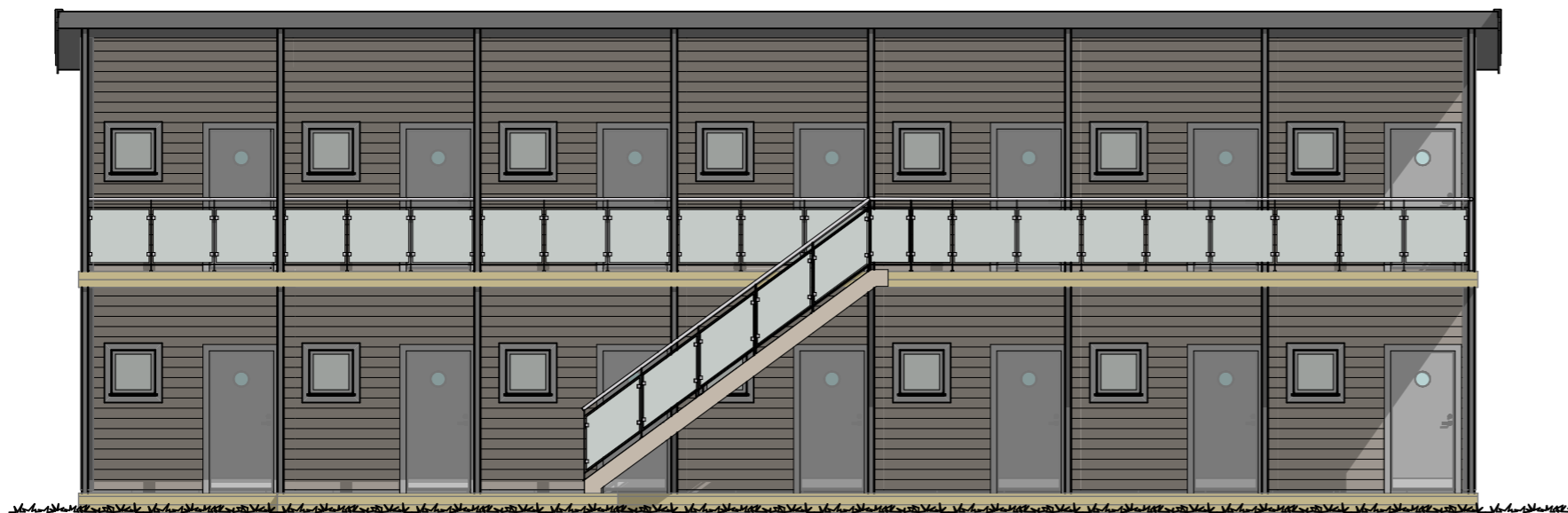
FASAD A1 1:100