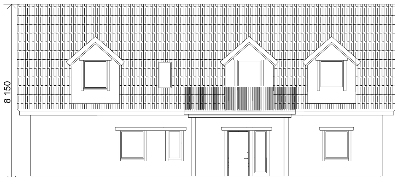
FATAD MOT SYD