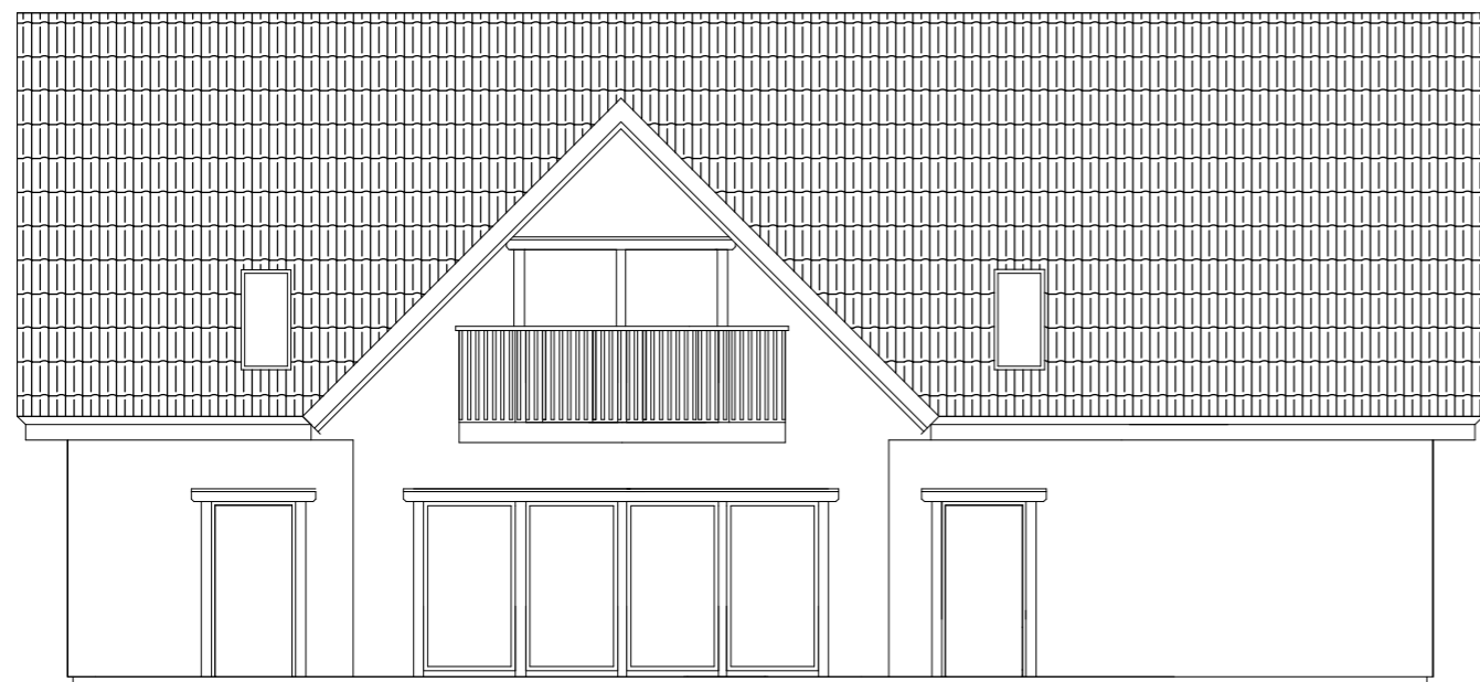
FATAD MOT NORD