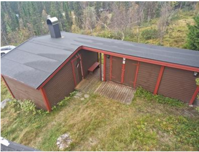
Anex med dusch, bastu och sovrum.