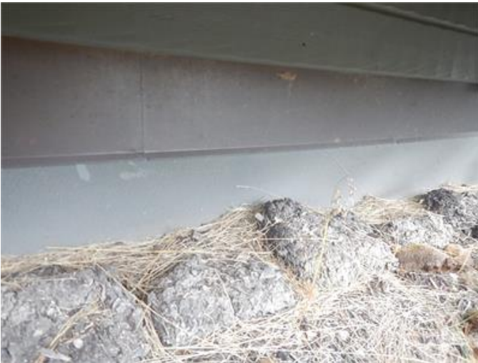
Grästak som bör kompletteras.