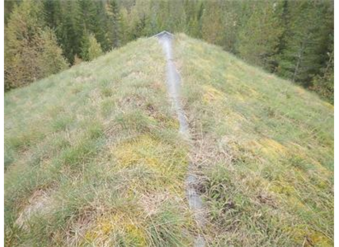
Grästak som bör kompletteras.