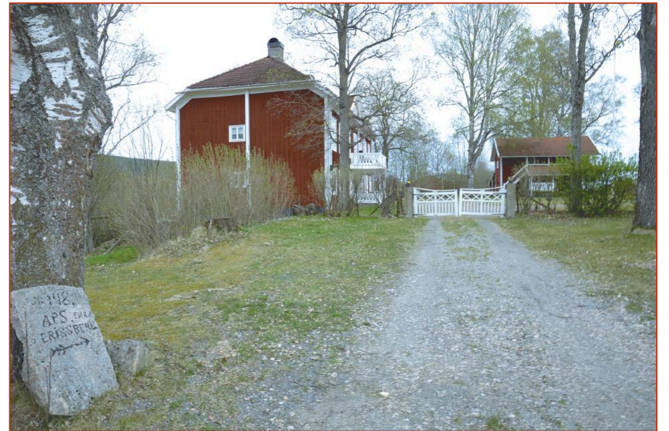
Infarten till gården. Till vänster ses stenen som sparades från den gamla ladugården som revs, med texten No 148 APS ENKA ERIKSBERG.