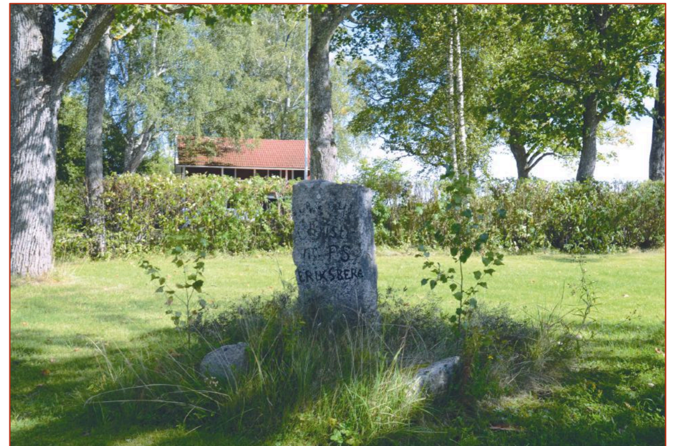
Till höger om infarten till gården återfinns denna sten med texten No 2, 241 Christina PS ERIKSBERG.