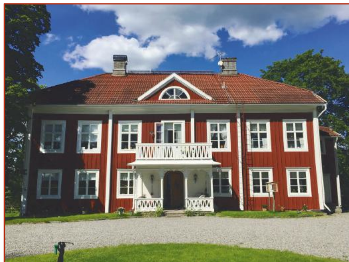
Eriksbergs Gård i sommarskrud.