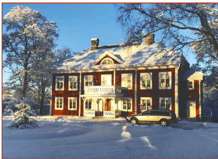
Eriksbergs Gård i vinterskrud.