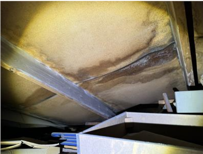
Fuktfläckar på underlagstak i garagets vindsutrymme.