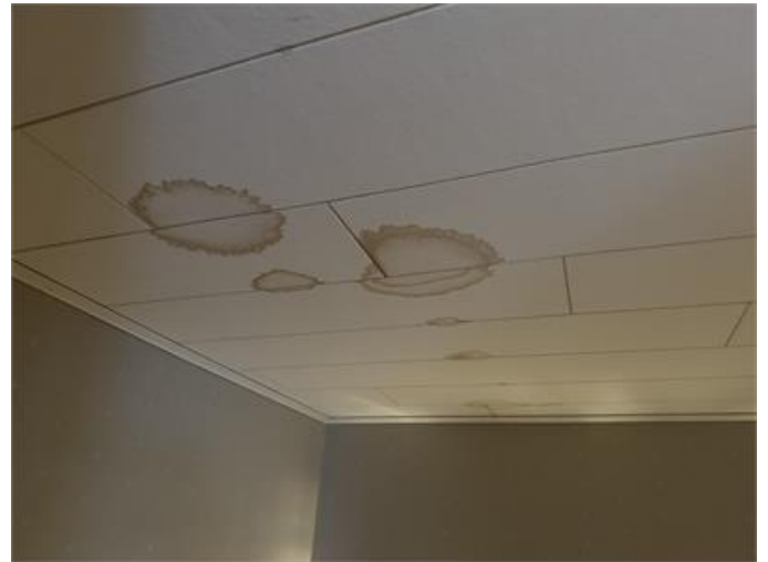
Fuktfläckar finns på innertaken i flera utrymmen.