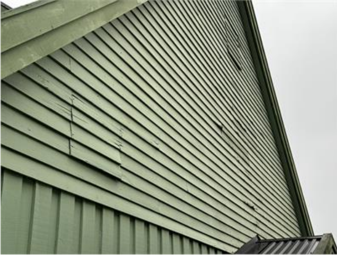
Rötskador på fasaden.