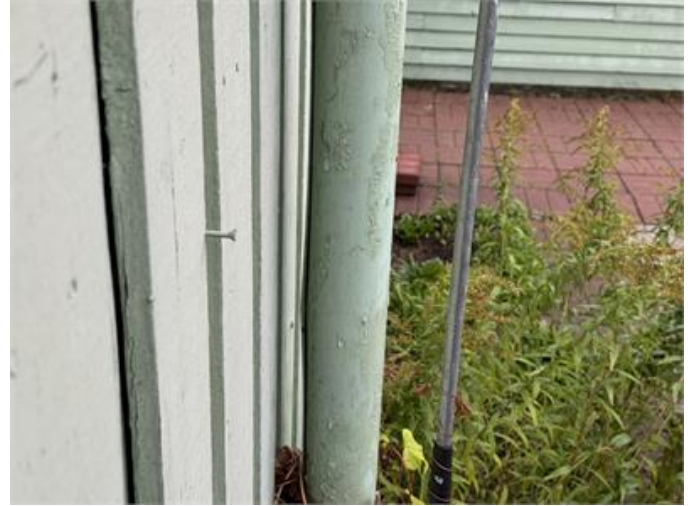
Frostsprängt stuprör med falsen vänd mot fasad.