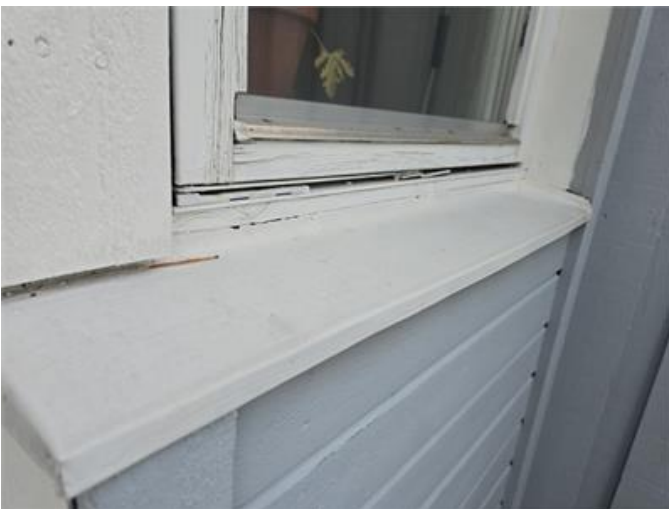
Exempel på fönster med underhållsbehov.