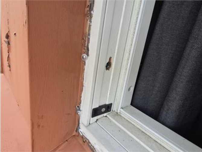
Exempel på brister mellan plåtkupa/fönster.