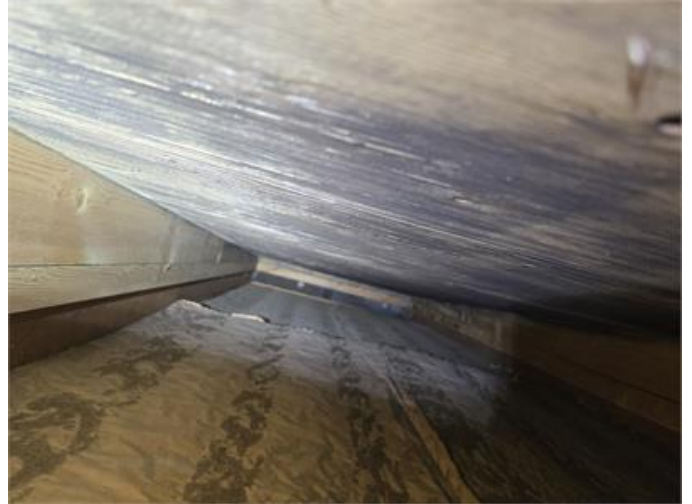
Missfärgningar/mikrobiell påväxt på del av underlagstak.