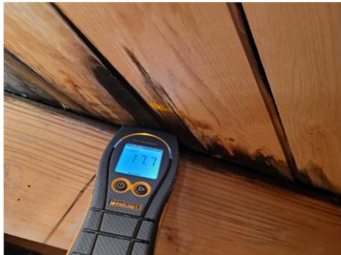
Läckage i yttertak