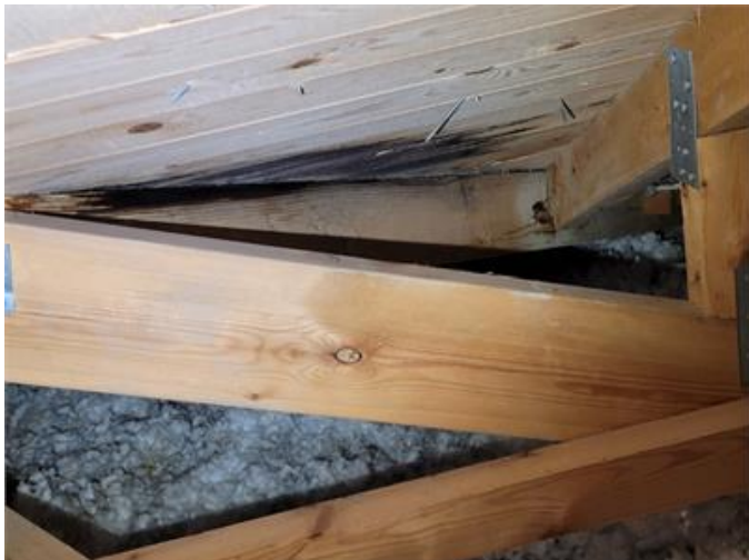
Läckage i yttertak