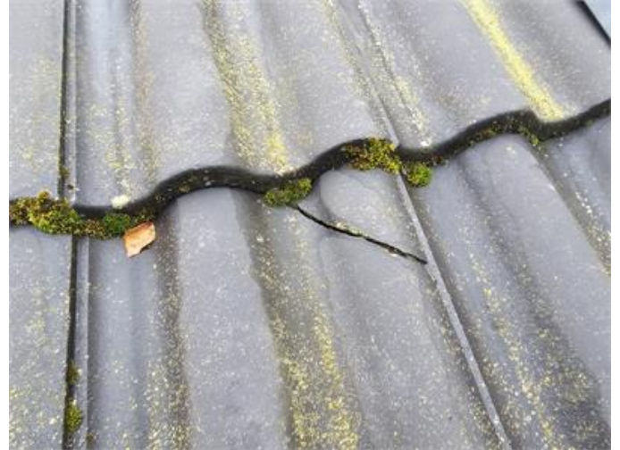
Exempelbild, sprucken takpanna och mosspåväxt.