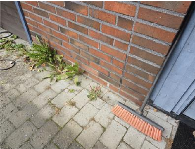
marknivå går lokalt över tegelfasadens underkant.