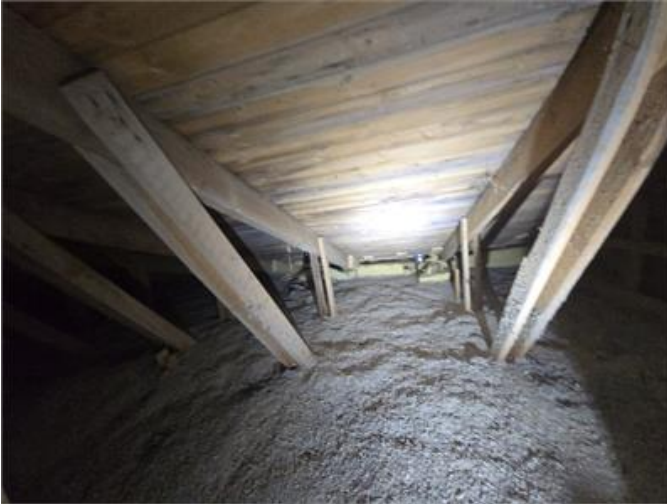
Exempelbild, mikrobiell påväxt underlagstak.