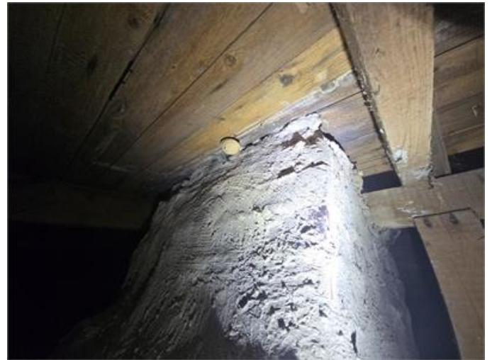
Exempelbild, fuktfläckar i underlagstak intill murstocken.