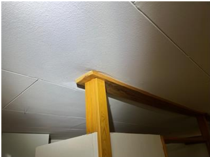
Pos 1. Sättningar och sprickor förekommer i innertak.