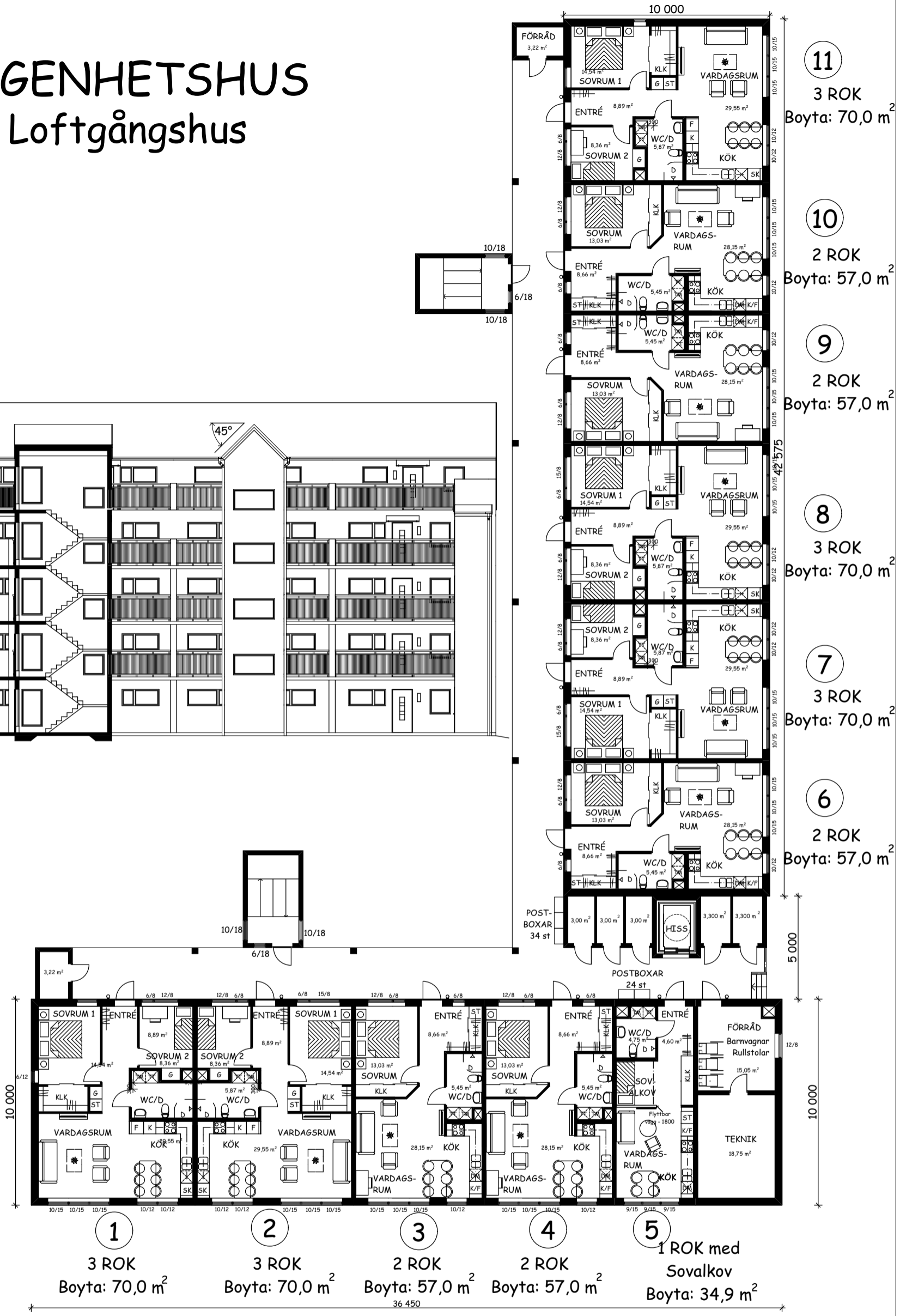
PLAN - VÅNING 1