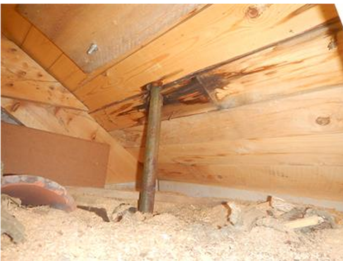
Fuktpåverkan på underlagstak vind.