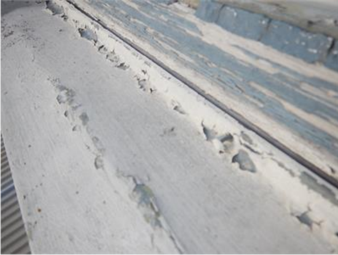
Fönsterbleck har släppt i infästning.