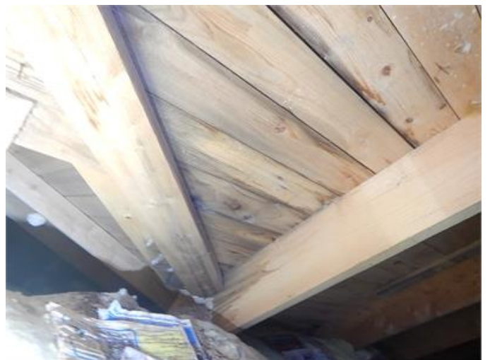
Fuktpåverkan på underlagstak vind.