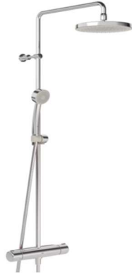
Blandare och Duschpaket, Mora, Oras.