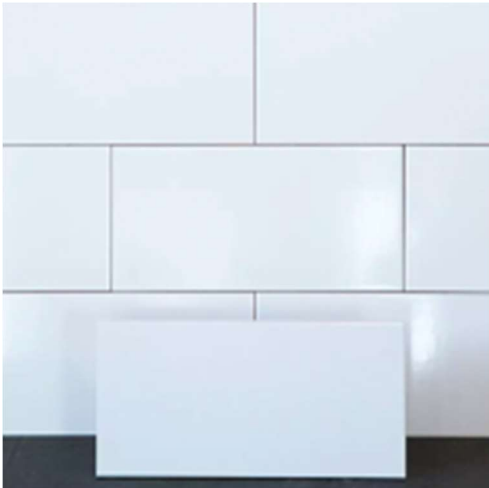
Väggar i vitt kakel.