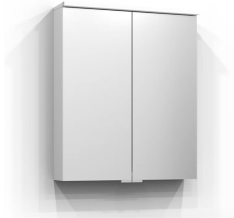
Spegelskåp med belysning, typ Svedberg eller liknande.