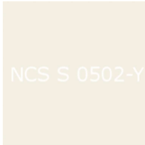
Vitmålad gips i tak i NCS: 0502-Y. Traditionell vit.