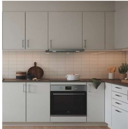
Kök från Länghem. Slät vit som standard.