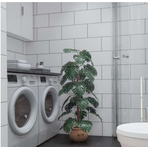
Tvätt och tork med överskåp.