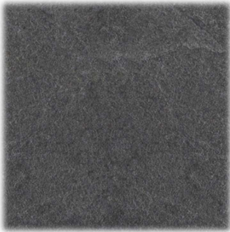
Bänkskiva – Laminat