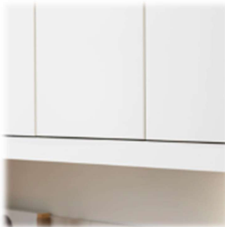
Fronter i slät vit.