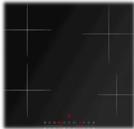
Spishäll med induktion. Cylinda