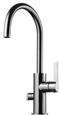
Blandare i krom, Typ Oras, Mora.

Denna lista innehåller beskrivning av den standard som finns i bostäderna. Vi reserverar oss rätten att göra ändringar och att produkter inte upplevs likadant i häftet som i verkligheten, dessa ändringar kan uppkomma ex till följd av ändringar i leverantörers kataloger och utbud.