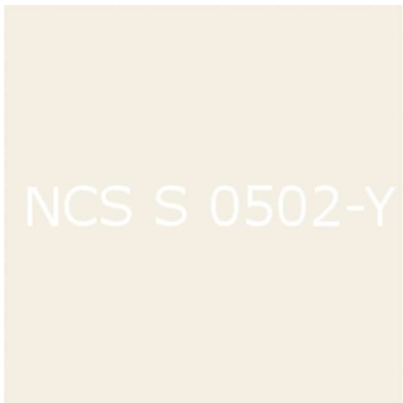
Vitmålad släta foder och sockel i NCS: S0502-Y