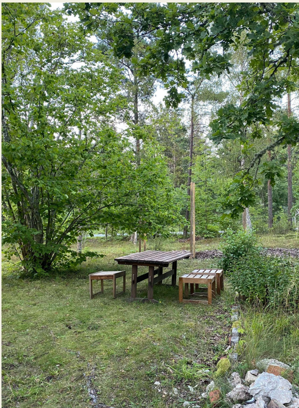
frukostplats på husets framsida