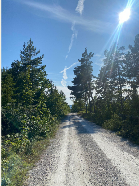
Vägen till bryggan i augusti, havet skymtar längst fram