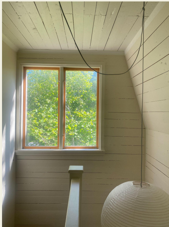
Grönska runt huset sett inifrån