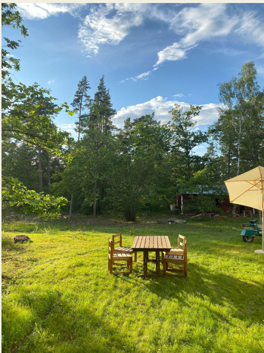
28 juli, kl 19.30