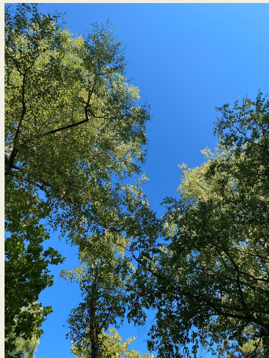
Trädkronor på tomten i augusti