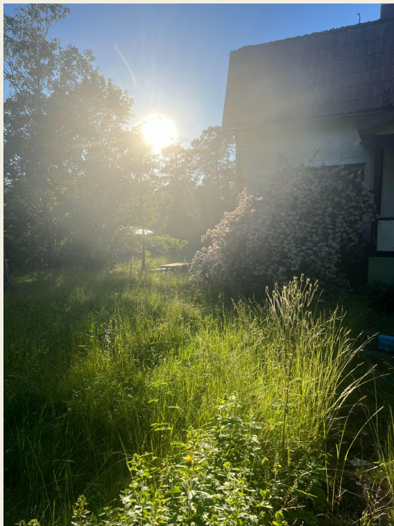
25 juni, kl 19.45