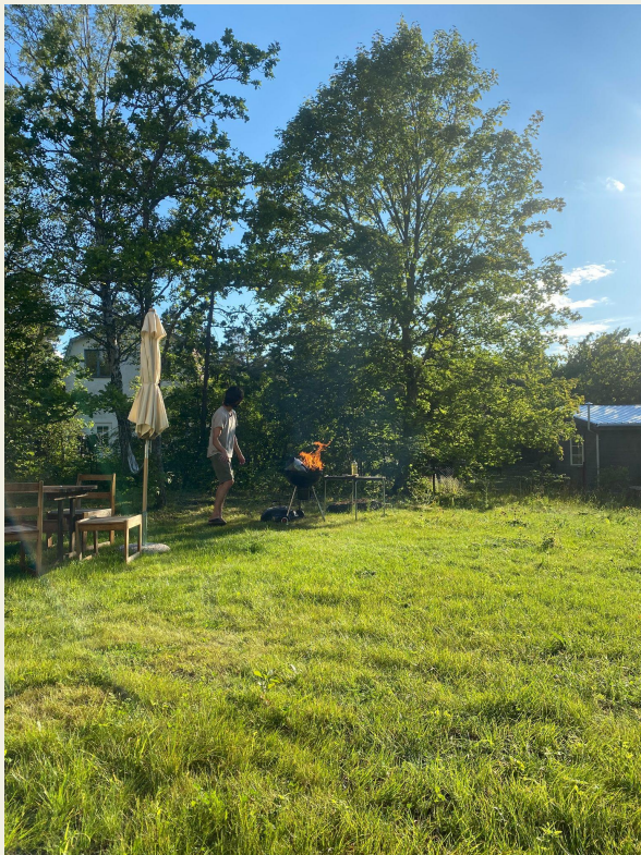
Träd i tomträns ger ett privat gårdsrum