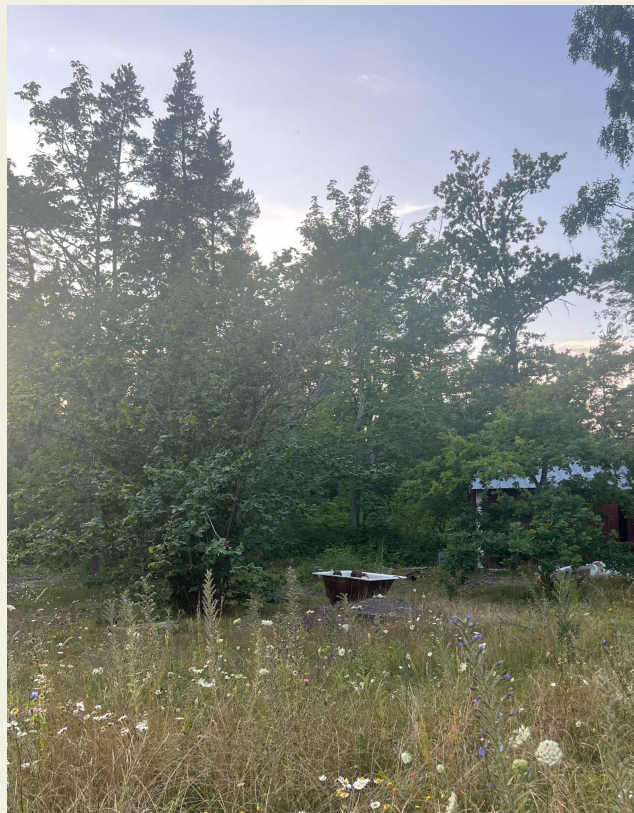
utepad på egen äng i skymning