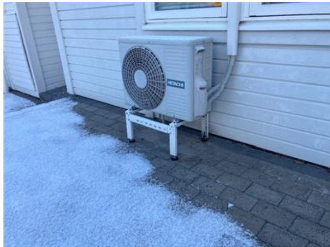
Värmepumpens utomhusdel vid fasaden