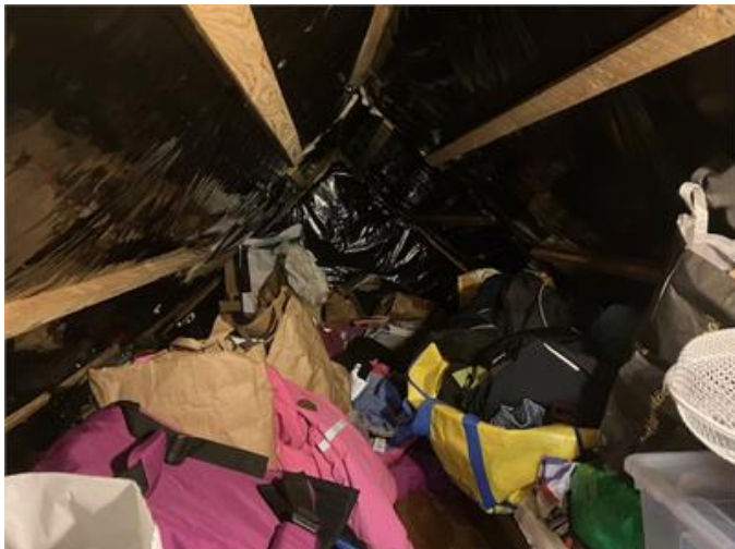
Bild tagen på vinden