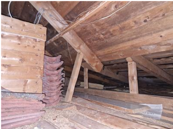
Vy på vind