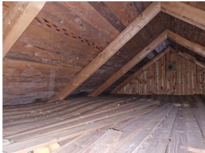
Vy på vind