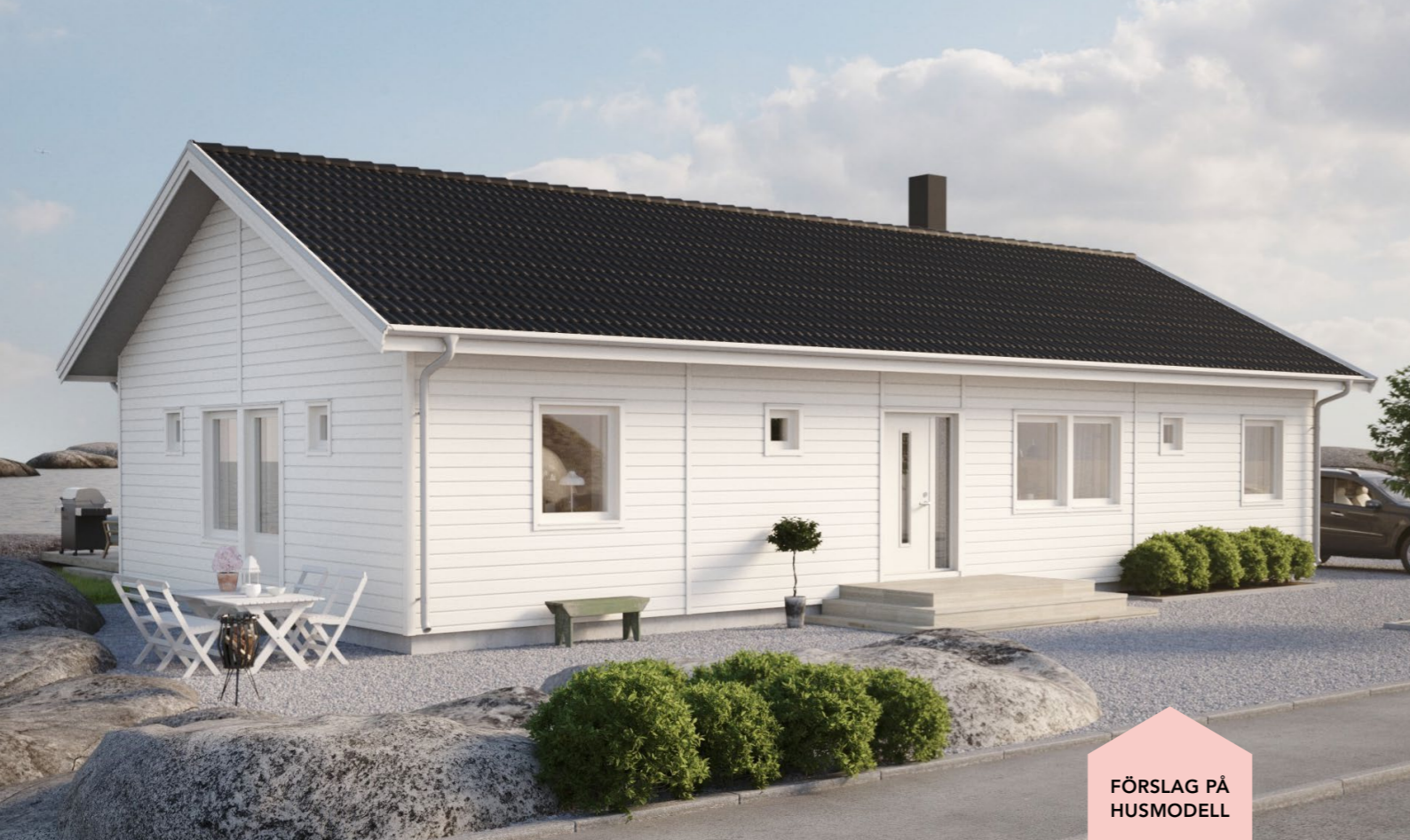
FÖRSLAG PÅ HUSMODELL