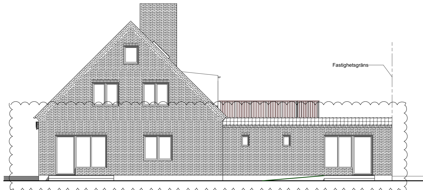
Fasad åt norr