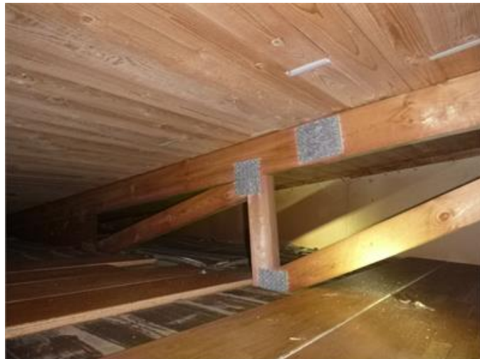
Bilden visar vy av vind.