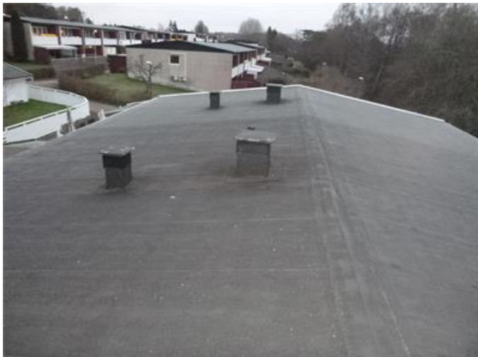
Bilden visar vy av tak.