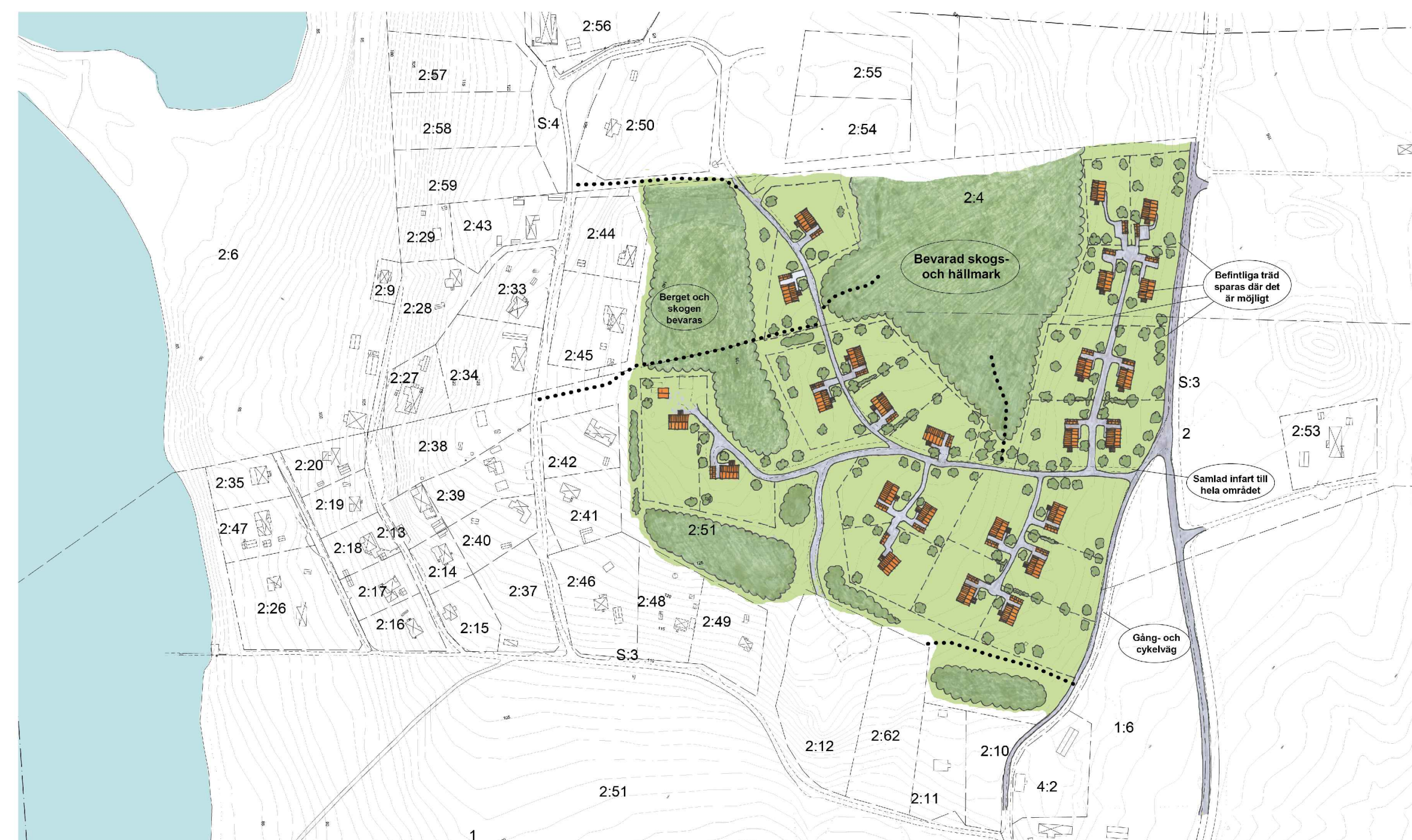
Illustrationsplan i skala 1:3000 (vid utskrift på A1)