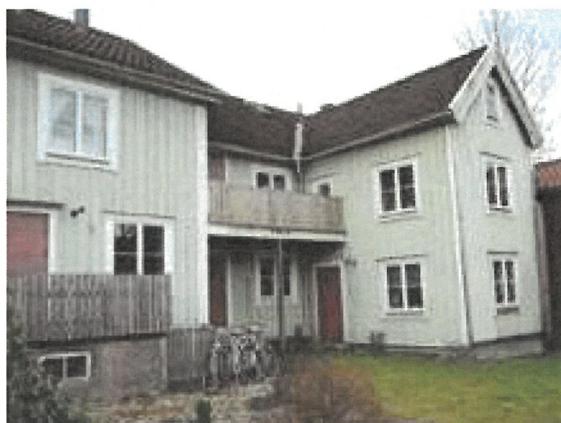
Gårdsmiljö mot öster.