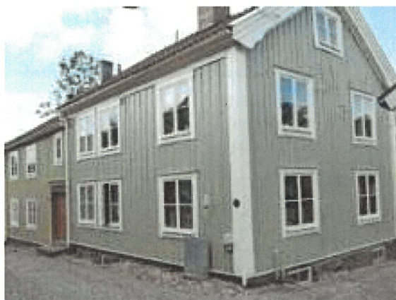
Fasad mot Arendt Byggmästares gata och söder.