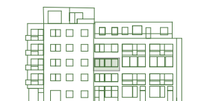
Fasad mot norr

Lägenheten värms upp av radiatorer som placeras i anslutning till fönster