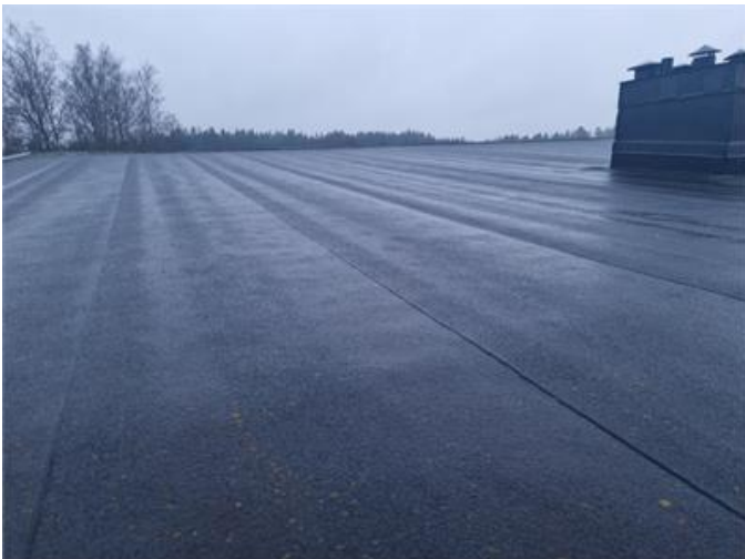
Vy på yttertak