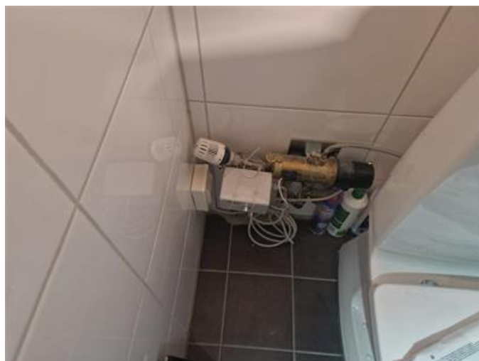
Installation för vattenburen golvvärme finns inbyggt vid wc stol i badrum på suterrängplan.