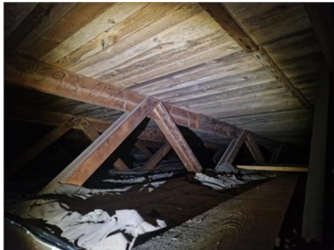
Vy på underlagstak