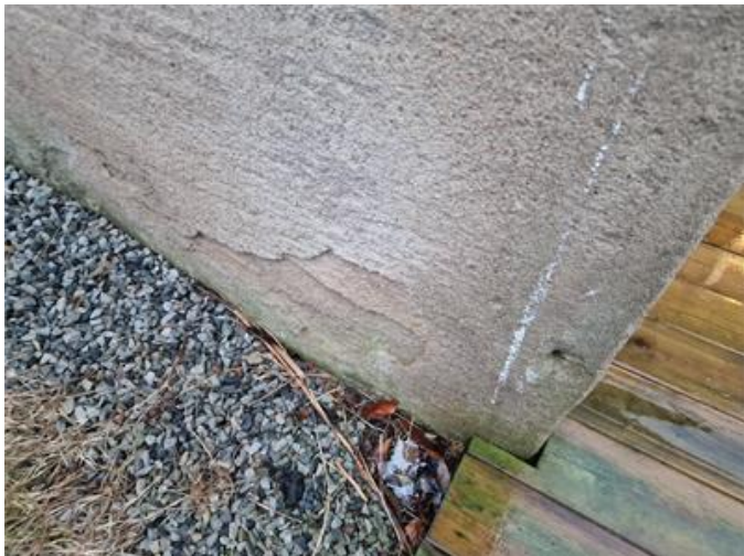
Putssläpp och enstaka sprickor noterades på sockeln.