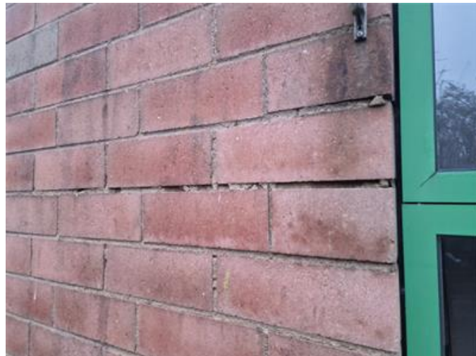
Enstaka sprickor förekommer i stenfasaden.