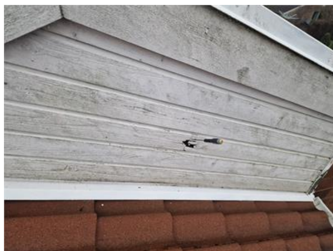
Rötskadad träpanel förekommer på gavelspetsen.