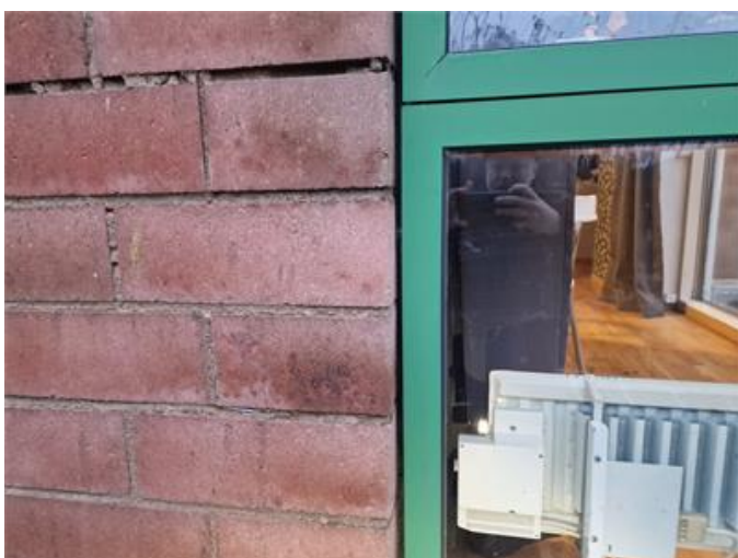
Gliporna mellan fönster och fönstersmyg är tätade med mjukfog.