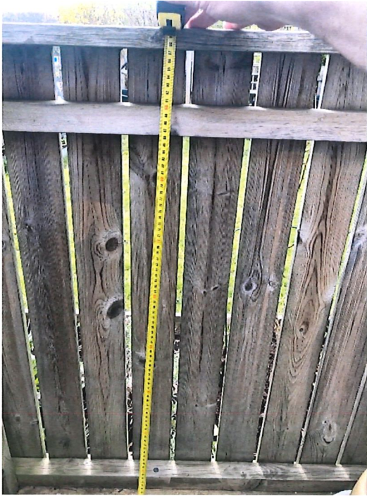
Insida altan (100cm högt från golv)