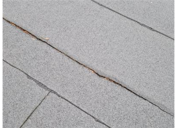
Garage: Sprickor förekommer i takpapp.