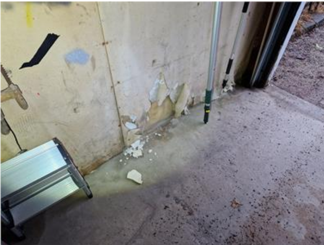
Garage: Fuktskador konstaterades i bla väggkonstruktion.