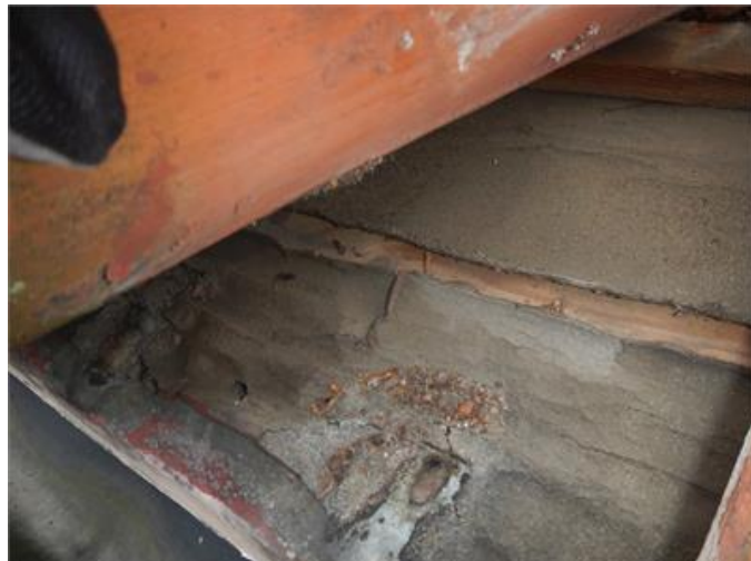
Underlagspappen under takpannorna är delvis sprucken och vittrad.