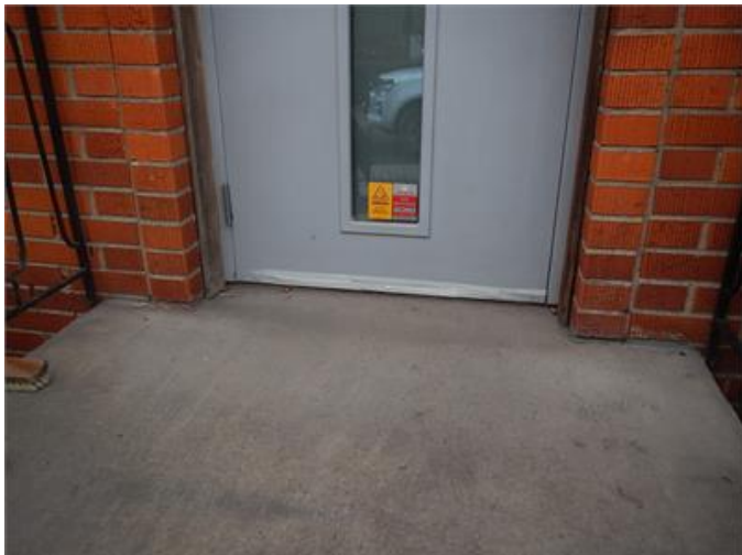
Ingen tröskelplåt på entrédörren.