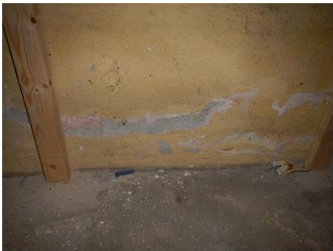
Fuktgenomslag på källaryttvägg.