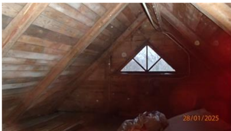
Bild på vinden