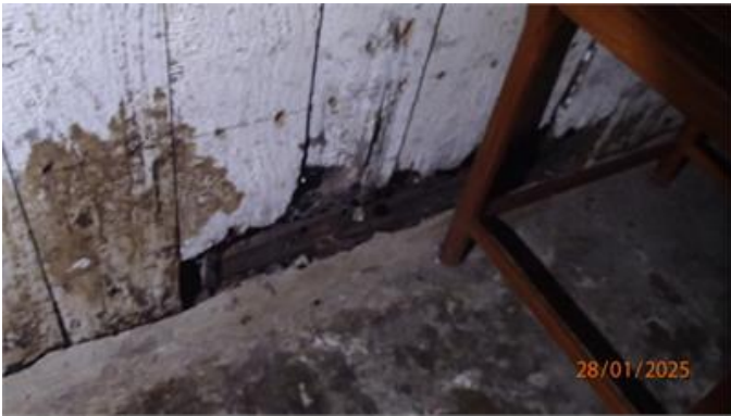
Rötskadad vägg i källaren