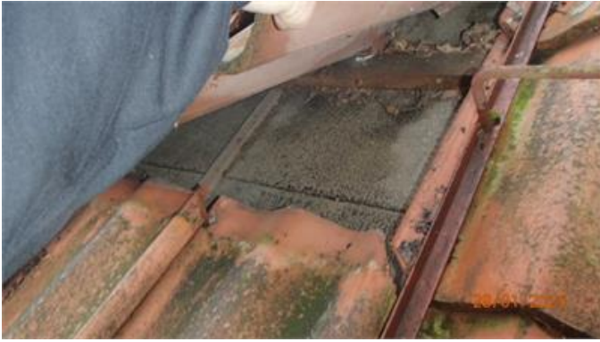
Bild på underlags pappen