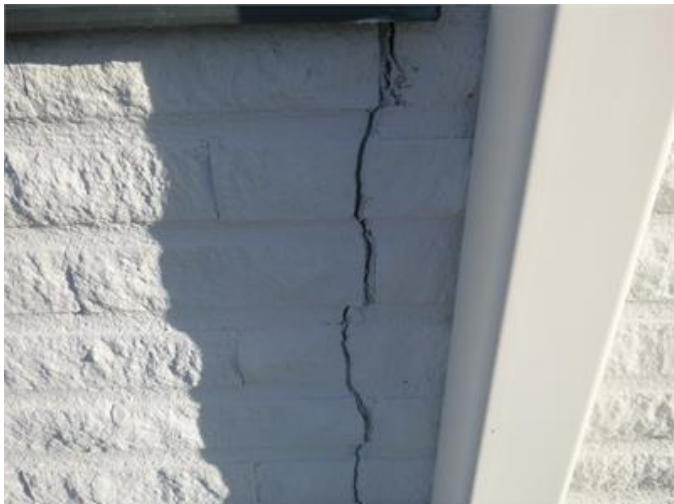
Bilden visar exempel på spricka i fasaden.