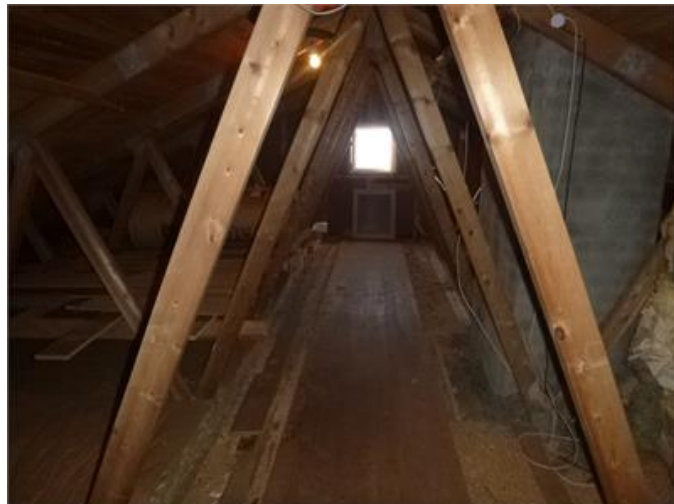
Bilden visar vy av vind.