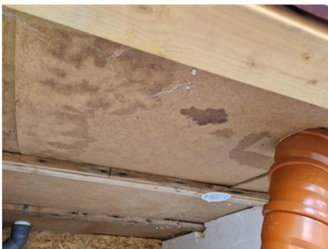
Plintgrund: Fuktfläckar förekommer i isolerat teknikutrymme