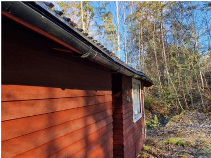
Hängrännor och Stuprör: Bakfall förekommer på hängrännor