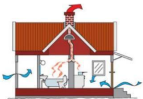
Frisk luft är bra för hus och kropp

Frisk luft, en ren hälsofråga. Eftersom vi vistas inomhus mer än 70 % av vår tid så är det av högsta vikt att vi skall ha en väl fungerande ventilation i våra hus.