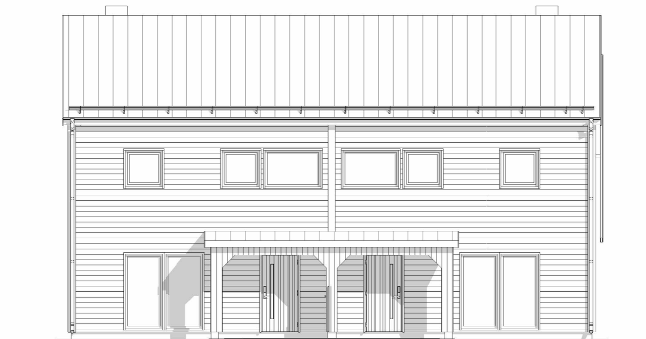
FASAD MOT ENTRÉSIDA