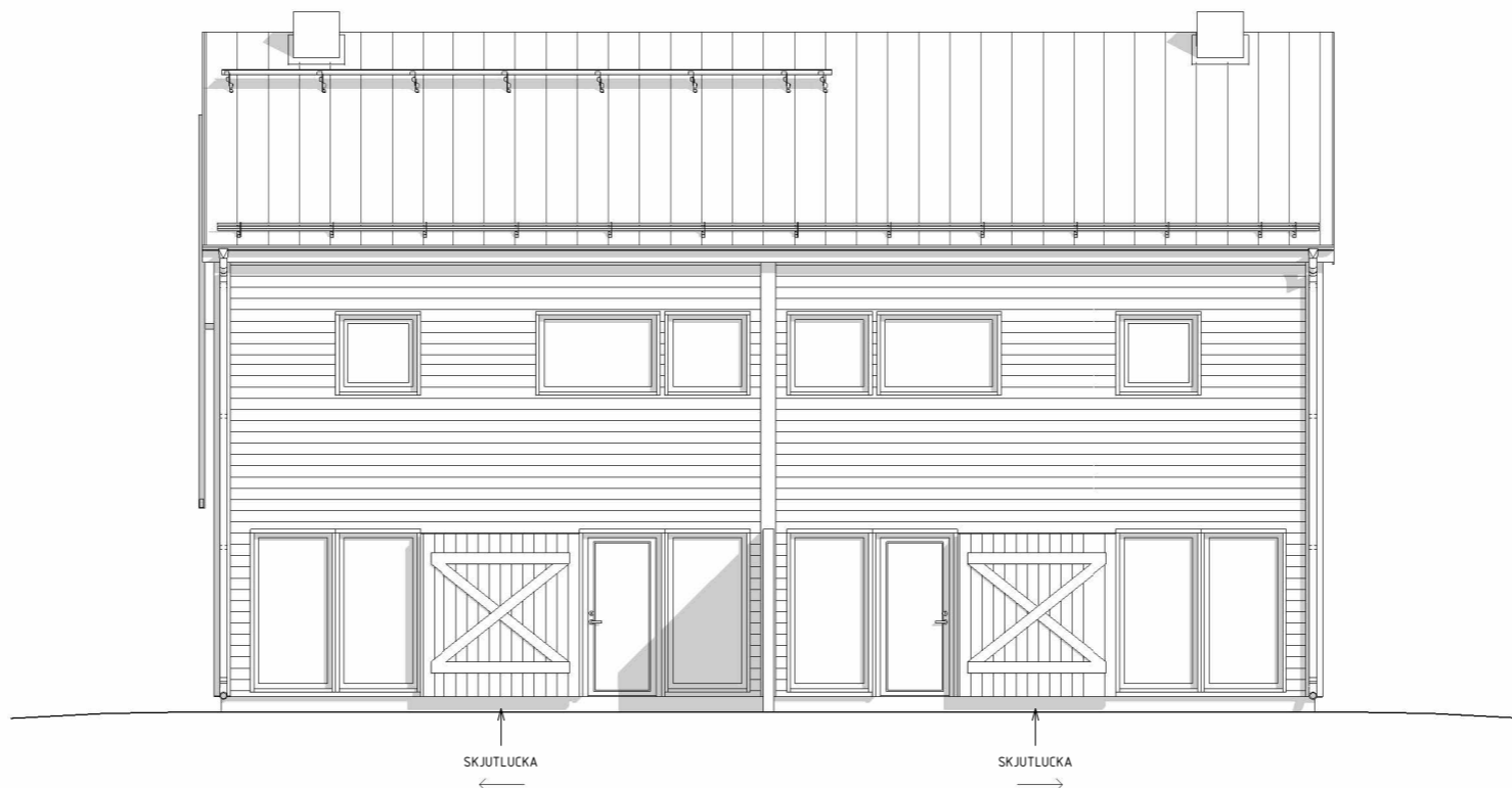
FASAD MOT TRÄDGÅRD