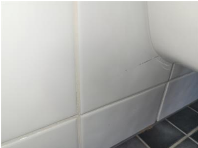
Sprickor i kakel invid wc och bidé