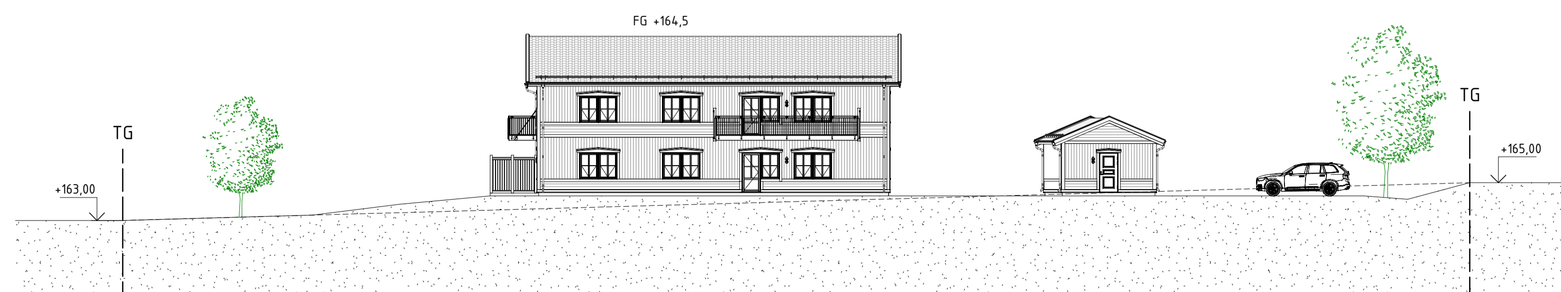
VY FRÅN VÄSTER