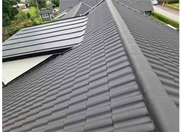
Vy på yttertak