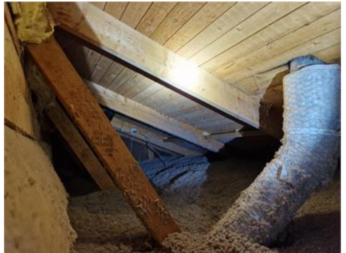
Vy på del av sidovind