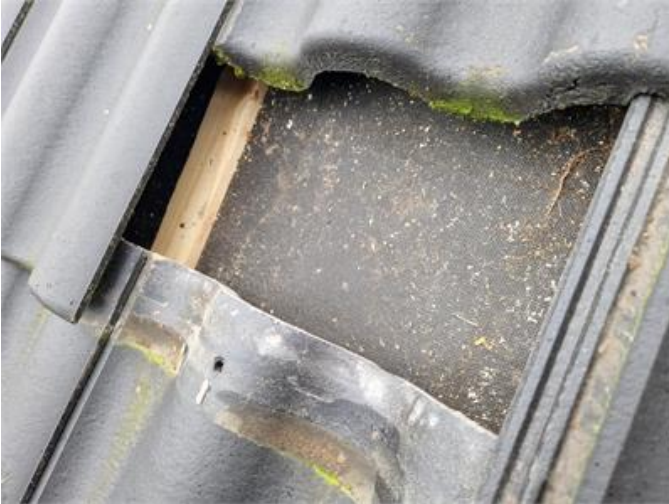
Vy på underlagstak med tunn ströläkt