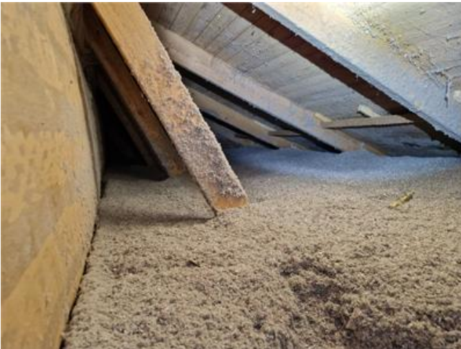
Vy på del av sidovind