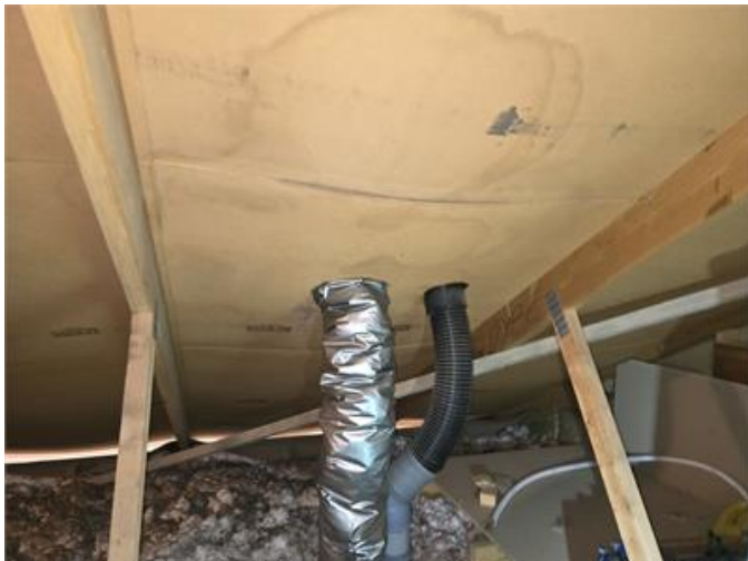
Exempel på fuktfläckar i underlagstak.