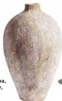
Vas Luna, 1 649 kr, Muubs.