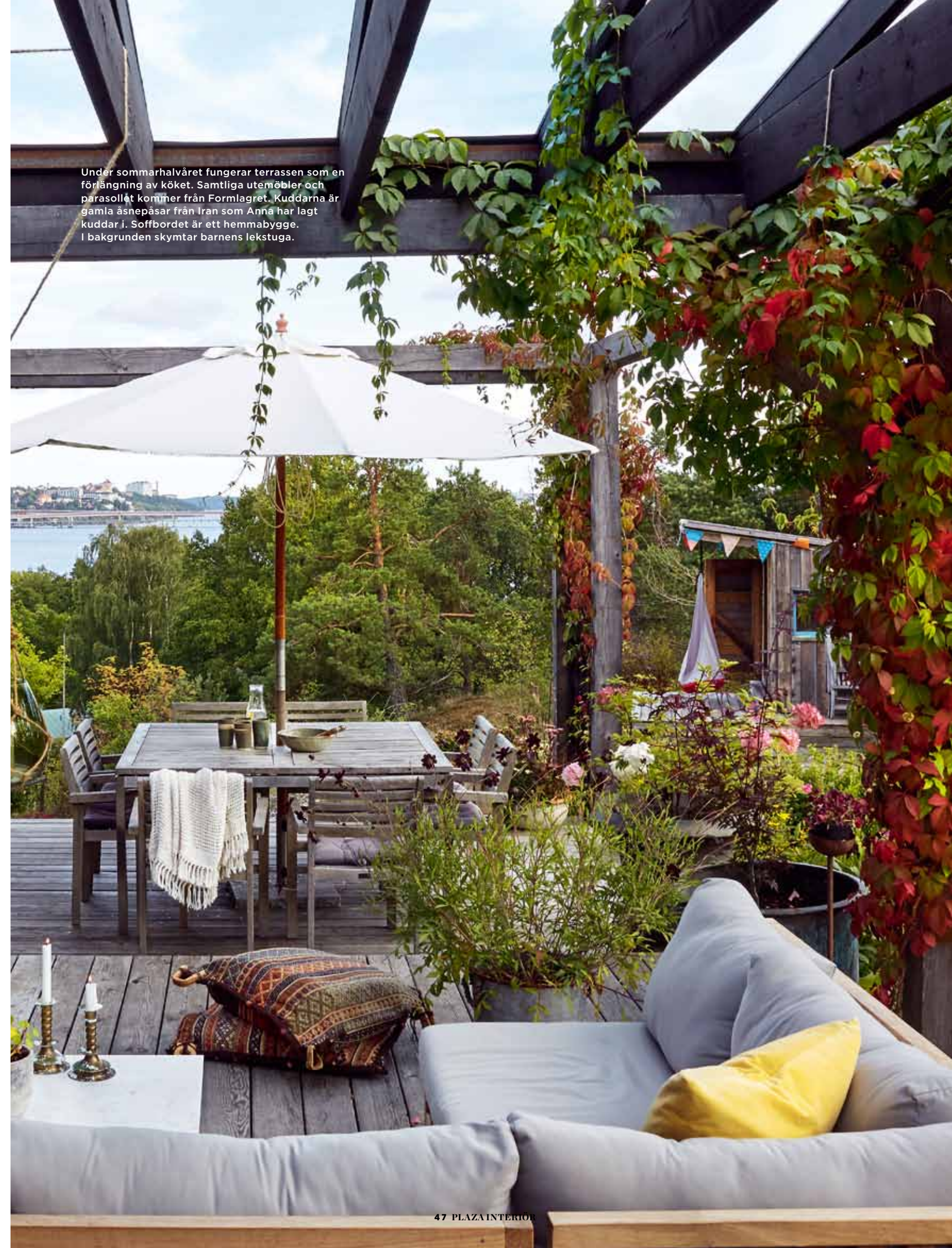
Under sommarhalvåret fungerar terrassen som en förlängning av köket. Samtliga utemöbler och parasollet kommer från Formlagret. Kuddarna är gamla åsnepåsar från Iran som Anna har lagt kuddar i. Soffbordet är ett hemmabygge. I bakgrunden skymtar barnens lekstuga.