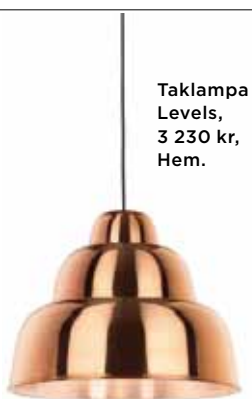
Taklampa Levels, 3 230 kr, Hem.