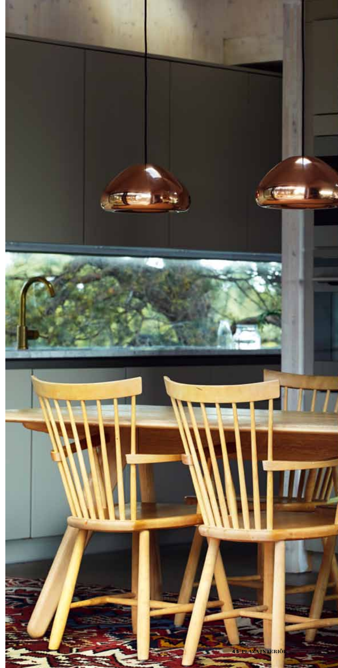
Runt Slab Table av Tom Dixon står Lilla Åland-stolar av Carl Malmsten. Lamporna är Void Light av Tom Dixon och mattan är en persisk matta som paret har ärvt.