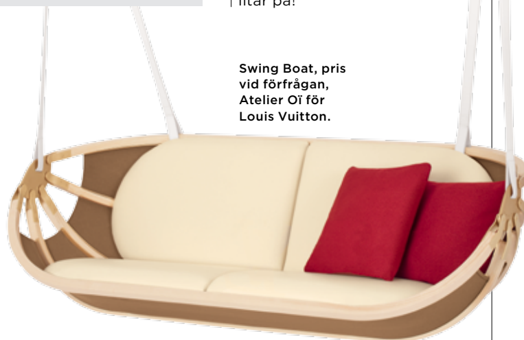
Swing Boat, pris vid förfrågan, Atelier Oi för Louis Vuitton.