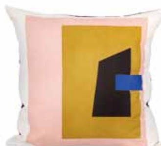
Kudde Fragment, 565 kr, Ferm Living.