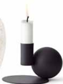
Ljusstake Optical, 500 kr, Menu.