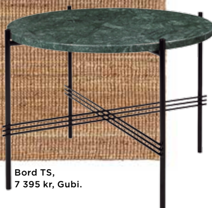
Bord TS, 7 395 kr, Gubi.