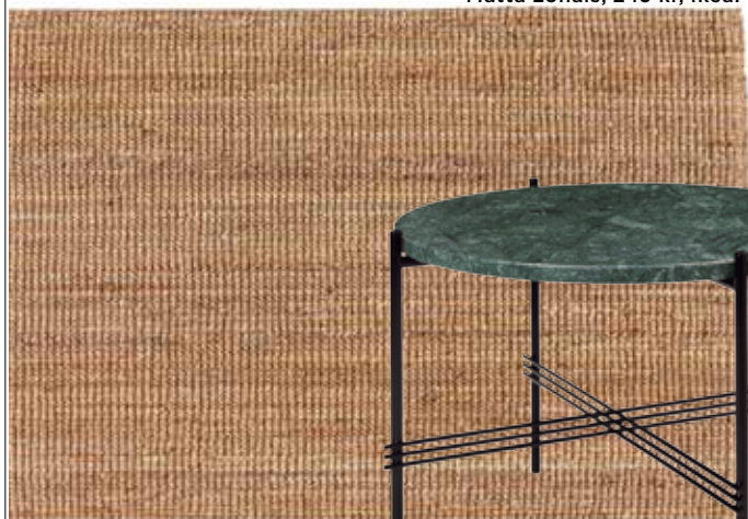
Matta Lohals, 249 kr, Ikea.