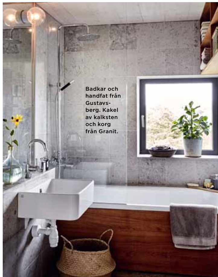
Badkar och handfat från Gustavsberg. Kachel av kalksten och korg från Granit.