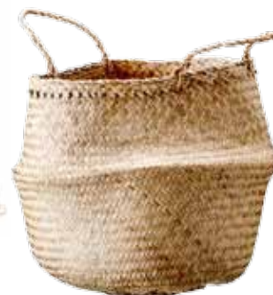
Korg Seagrass, 269 kr, Bloomingville.