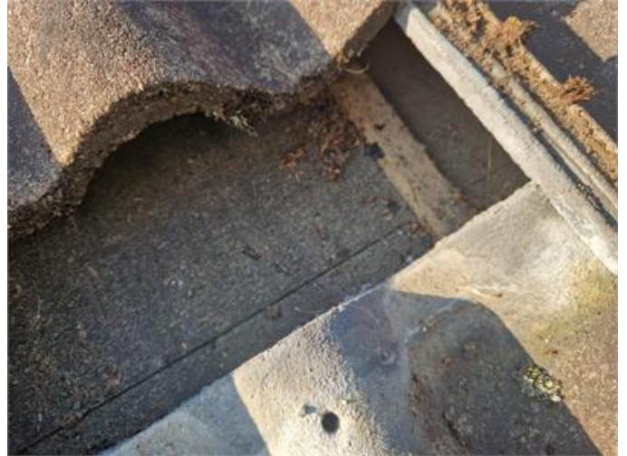
Vy på underlagstak