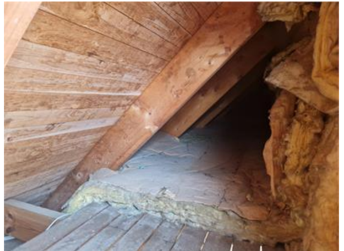
Vy på sidovind