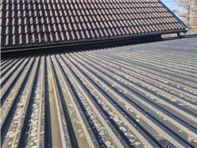
Vy på yttertak