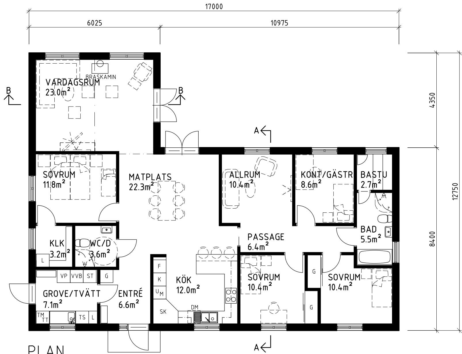
PLAN 169m 2 (BYA)