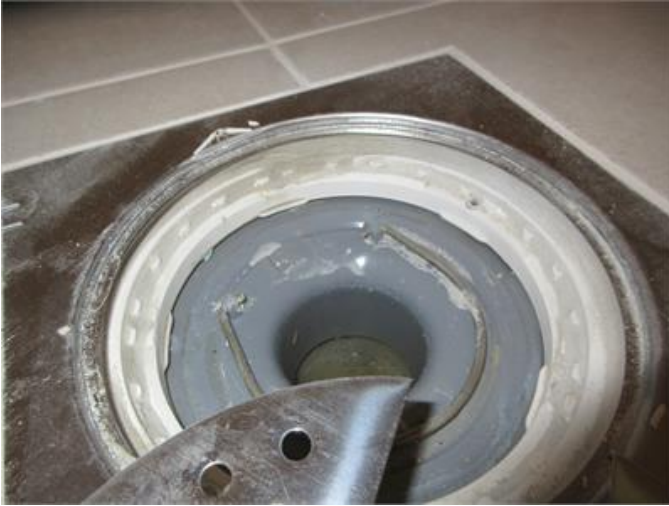
Golvbrunn utan synlig brunnsmanschett