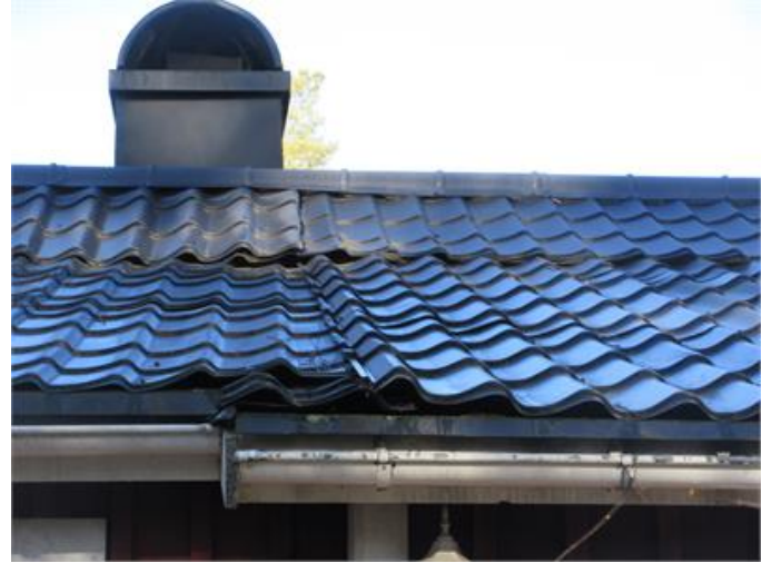
Takplåt som inte är tätslutande/fackmässigt monterad.