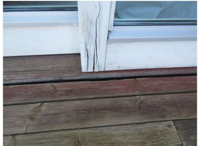
Rötskada i skjutdörrsparti