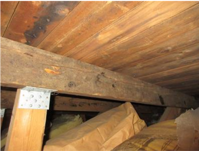
Sprickor i takstol