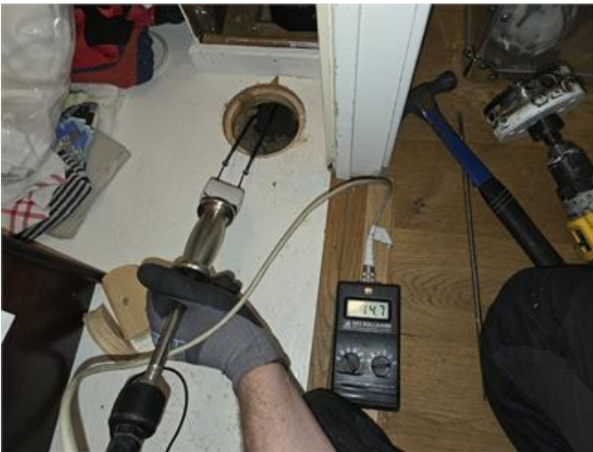
Mätning i förråd och golv.