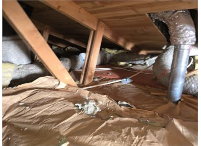
Exempel kanal som är oisolerad.