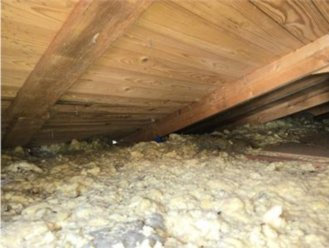
Exempel del av vind isolering ligger an mot taket och det förekommer påväxt.