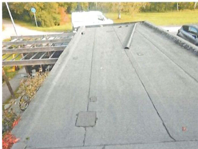
Lagningar av takpapp på garage