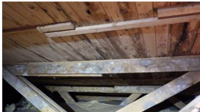
Mikrobiell påväxt på insida yttertaket på vinden